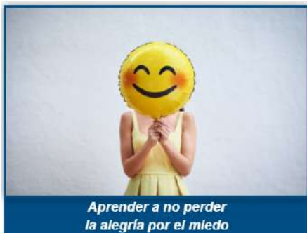
Aprender a no perder la alegría por el miedo

Family Training es un proyecto de Attendis on-line en el que el Gabinete Sophya ha colaborado con diferentes píldoras educativas de vuestros hijos durante la cuarentena domiciliaria.