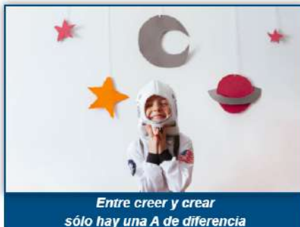
Entre creer y crear sólo hay una A de diferencia