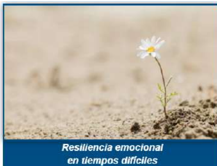
Resiliencia emocional en tiempos difíciles