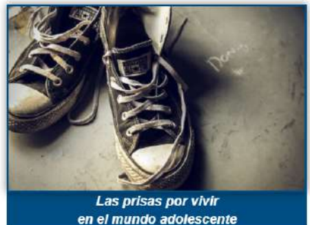
Las prisas por vivir en el mundo adolescente