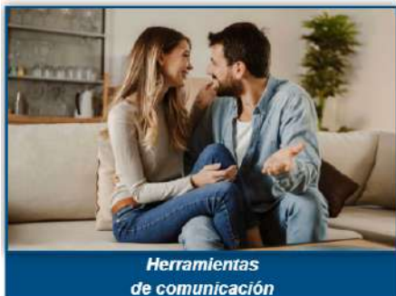
Herramientas de comunicación