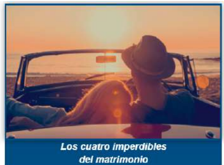
Los cuatro imperdibles del matrimonio